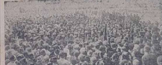
UM ASPECTO DA ENTREGA DA BANDEIRA AO BATALHAO "MARCONEZ SALGADO", ANTES DE PARTIR DESTA CAPITAL