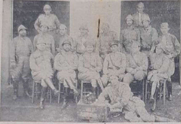
Notícia procedente de uma das plenas voluntárias do 1.º Batalhão Jauense de operações da zona da fronteira por que se tem portado a frente. Os bravos soldados têm-se batido com grande energia e audácia, demonstrando a preferência que têm por seu país.

O batalhão "Voluntários de Piratininga" comunica que se iniciará, a 1.º de Setembro vindouro, em seu quartel, a Alameda Barão de Limeira, 104, um alistamento especial, destinado à arma de artilharia de campanha.